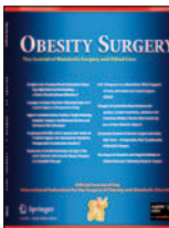
Obesity Surgery 25(12):2430-2435, Dic 2015