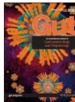
Gut 57(7): 893-902, Jul 2008