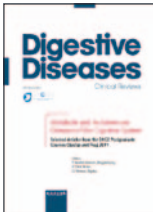
Digestive Diseases - Clinical Reviews 33(2):137-140, Abr 2015