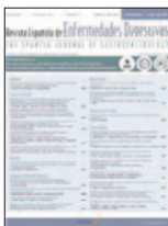
Revista Española de Enfermedades Digestivas 106(8):522-528, Sep 2014