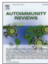
Autoimmunity Reviews 13(4):441-444, Abr 2014